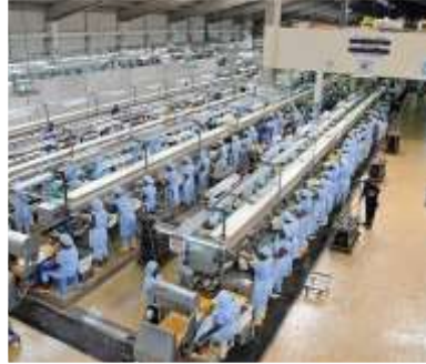
Conserveries / usines

30 thoniers senneurs sous pavillon: FRANCE – ESPAGNE – BELIZE – CURACAO – GUATEMALA – SALVADOR – PANAMA